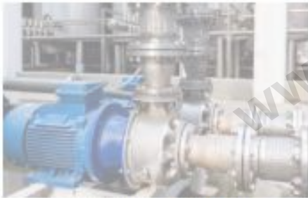
BOMBAS DE AGUA